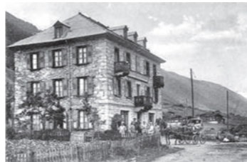
Die ehemalige Hotel-Pension Blinnenhorn in Reckingen in den 1920er Jahren.

Die bessere Erschliessung der Alpen war auch eine Folge des Ausbaus des Strassennetzes. Die Eisenbahn (1878 bis Brig, 1915 bis Münster) brachte mehr und mehr Besucher aus Schweizer Städten und aus dem Ausland, insbesondere aus Grossbritannien. Um 1900 sorgte schliesslich das Automobil dafür, dass der Tourismus auch entlegene Gebiete erreicht.