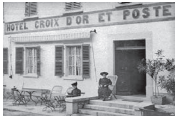
Zwei aristokratische Frauen auf der Treppe des Hotels Croix d'Or et Poste in Münster.

Die Hotels im Goms erfüllen diesen Anspruch voll und ganz. Die Landschaft, ob naturbelassen, gebirgig oder ländlich – ist einfach überwältigend. Hohe Gipfel umgeben das Tal. Und was soll man erst von den Gletschern und dem jungen Rotten sagen? Es gibt zahlreiche Sportmöglichkeiten, sowohl im Sommer (Wandern, Alpinismus) als auch im Winter (Langlauf). Die Besucher finden in den Gemeinden Goms und Obergoms rund 20 Unterkünfte. Diese Hotels blicken auf eine reiche Vergangenheit zurück. Andere, die jetzt nicht mehr existieren, fielen den Flammen oder sogar einer Lawine zum Opfer. Einige wurden umgenutzt oder mussten Konkurs anmelden. Die Geschichte des Tourismus ist hier zwischen den Zeilen lesbar. Die Region und ihre Pässe - Furka, Grimsel und Nufenen - wurden schon lange vor dem Aufkommen des modernen Tourismus von Kolporteurs, Hausierern, Pilgern und anderen Reisenden durchquert. Hospize boten ihnen eine wohlthätige Aufnahme. Die ersten Gasthäuser dienten als Raststätten für Reisen mit der Postkutsche, der Kalesche oder zu Pferd. So etwa in Gletsch, wo 1830 ein Gasthaus eröffnet wurde. Zwischen 1850 und 1870 wurde dieses in ein Hotel umgebaut (Glacier du Rhône) 1 .