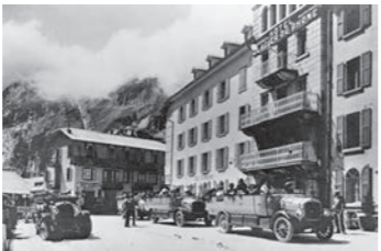
Das Hotel du Glacier du Rhône in Gletsch in den frühen 1920er Jahren.

„Location, location, location“, was auf Deutsch soviel heisst wie „Lage, Lage, Lage“. Wer kennt diesen Satz nicht, der dem Hotelmagnaten Conrad Hilton zugeschrieben wird?