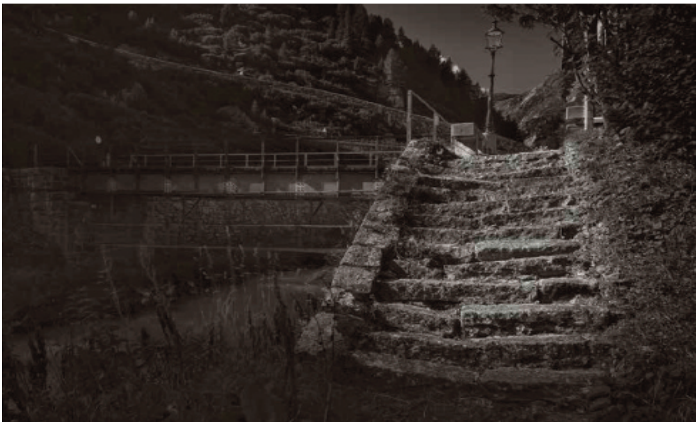
D'une rive à l'autre, Gletsch

L'an passé, l'association Edelweiss demandait aux professionnels comme aux amateurs de "la faire rêver" en couleurs ou en noir et blanc avec des photographies autour des escaliers. Il fallait livrer, avant le 31 octobre minuit pile, une série de quatre à six photographies.