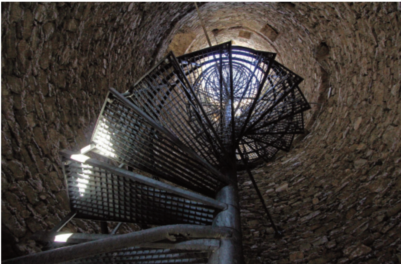
Vue en contre-plongée sur l'escalier de la Tour de Saxon