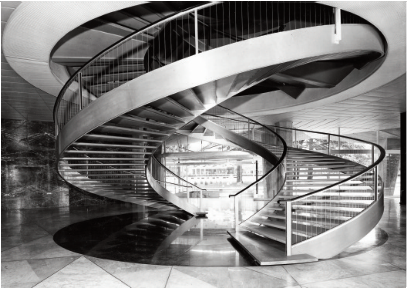
Vue de l'escalier en double hélice du siège de Nestlé (1960) de Jean Tschumi à Vevey