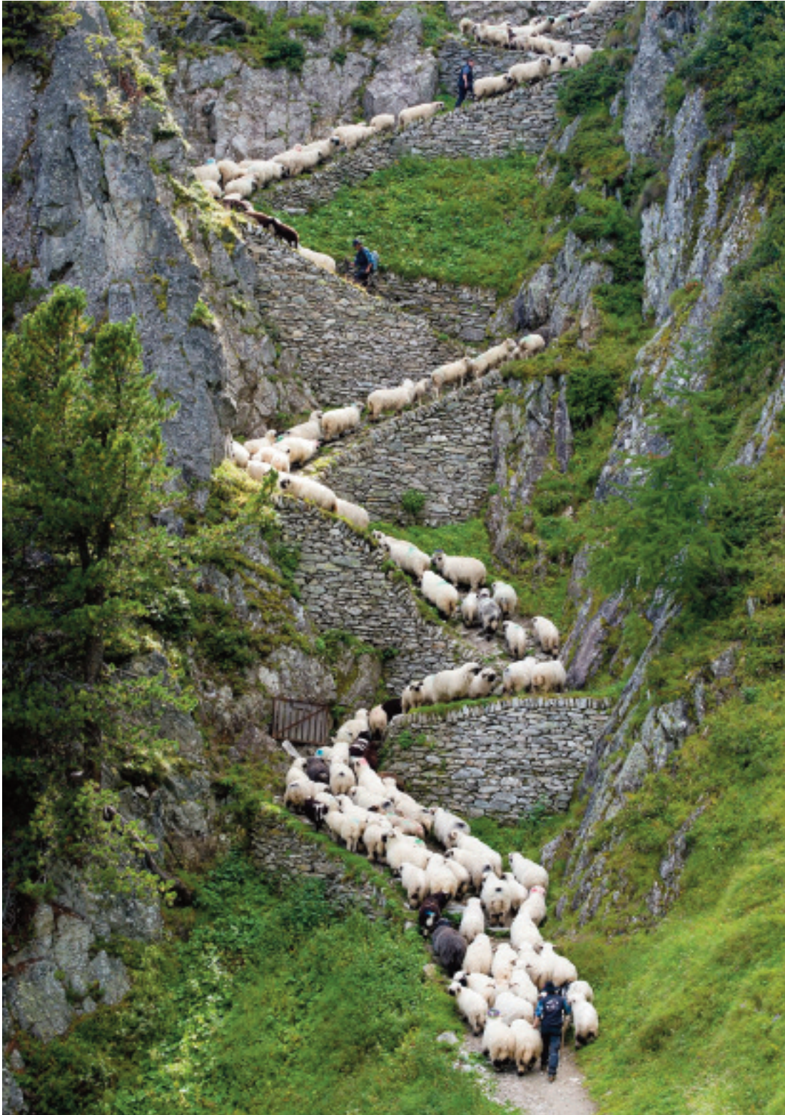
Impressionnant escalier emprunté par les moutons lors de la montée à l'alpage vers « l'Aletschji » (Belalp)