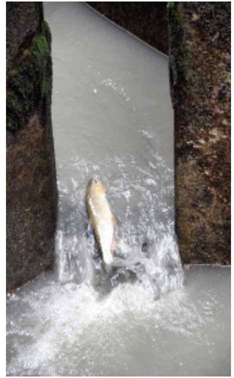
Un chevesne passe une marche entre deux bassins du barrage de Verbois

- que vous trouvez à Martigny un escalier en trompe l'œil né d'un traumatisme ? ( Sam Szafran, durant son enfance, avait été suspendu dans le vide d'une cage d'escalier par son oncle... )