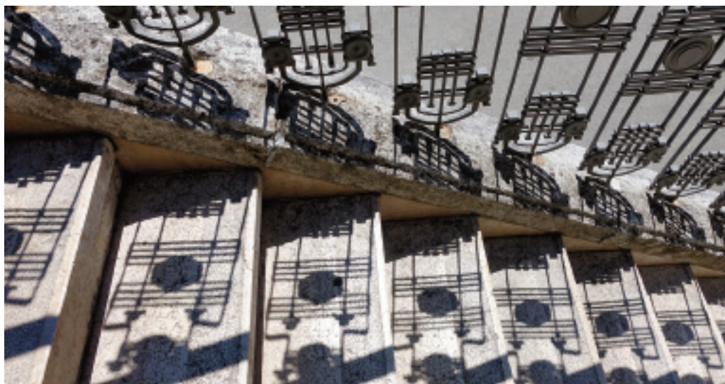
La partition éphémère de l'escalier de Pula

Marie-José Wiedmer explique : « Lui consacrer un ouvrage s'impose comme une évidence, par le fait que la Suisse détient le record du plus long escalier du monde et que cet organe de la circulation verticale, souvent banalisé, a besoin de retrouver ses lettres de noblesse. Fondé sur des observations, expériences et questionnements de 39 auteurs, cet ouvrage délivre une approche pluridisciplinaire en mettant en lumière la dimension singulière de nombreux escaliers ordinaires comme emblématiques. »