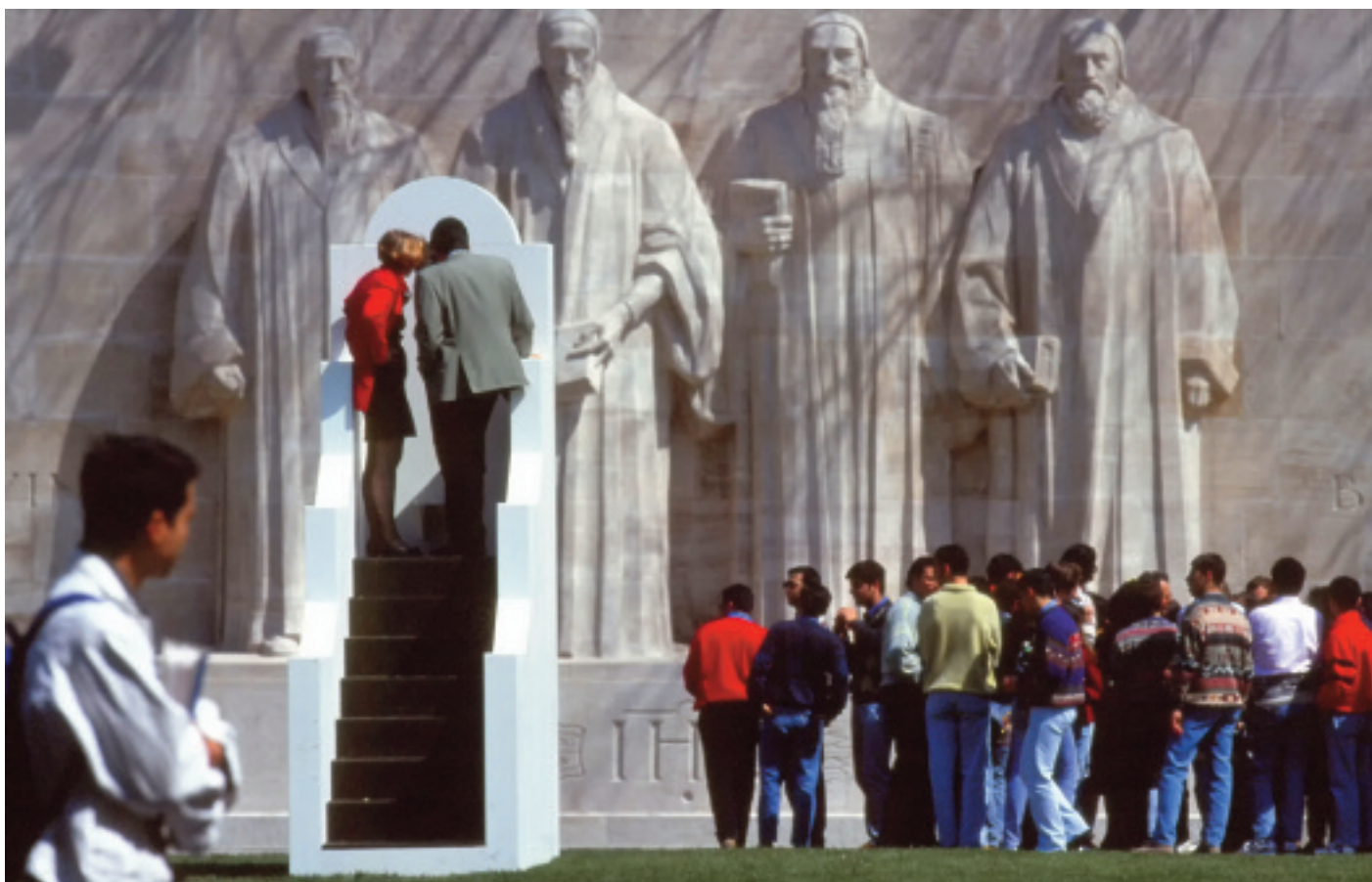
L'escalier devant le Mur de la Réformation à Genève, événement « The Stairs » du 23 avril au 31 juillet 1994