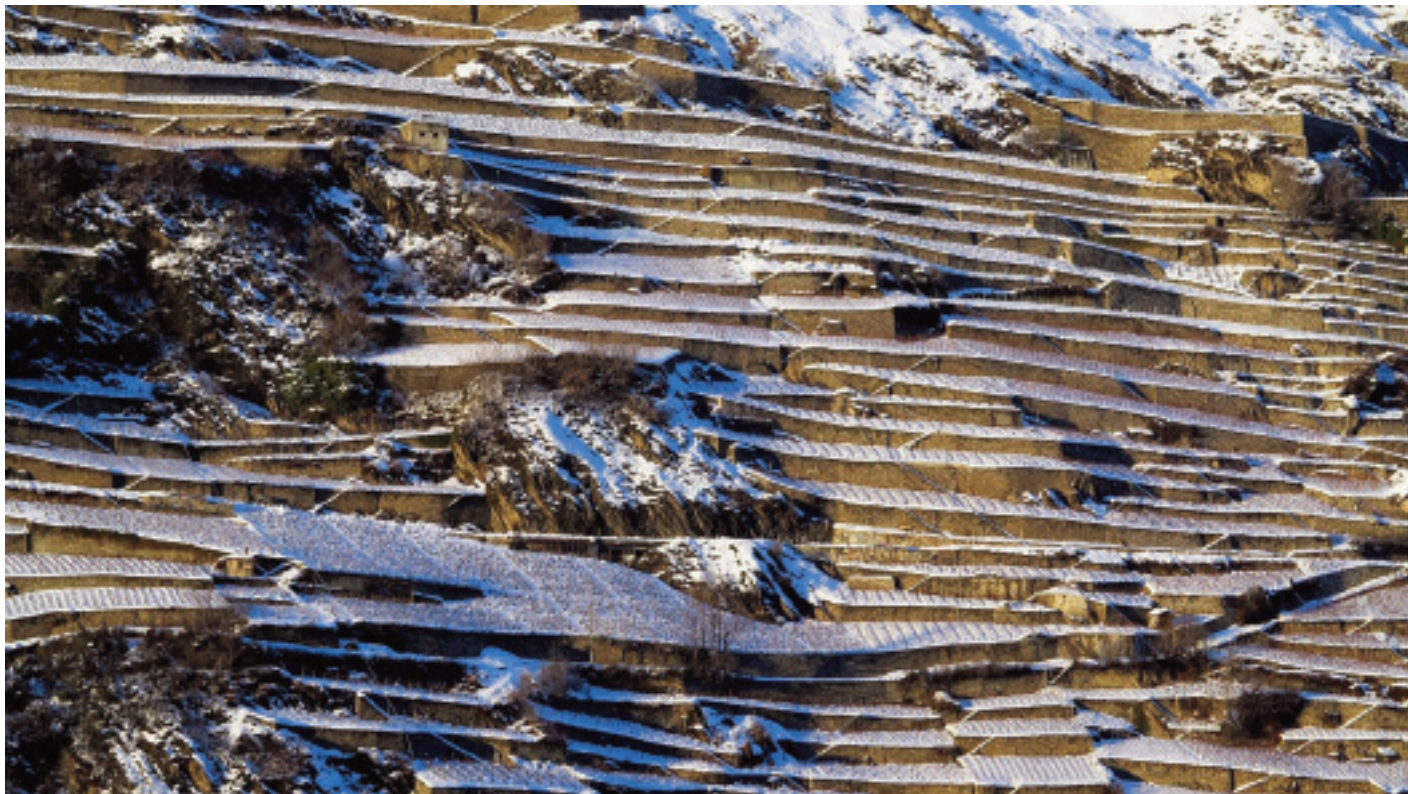
Le vignoble du Clavau près de Sion, où la neige souligne la présence des tablards et des escaliers