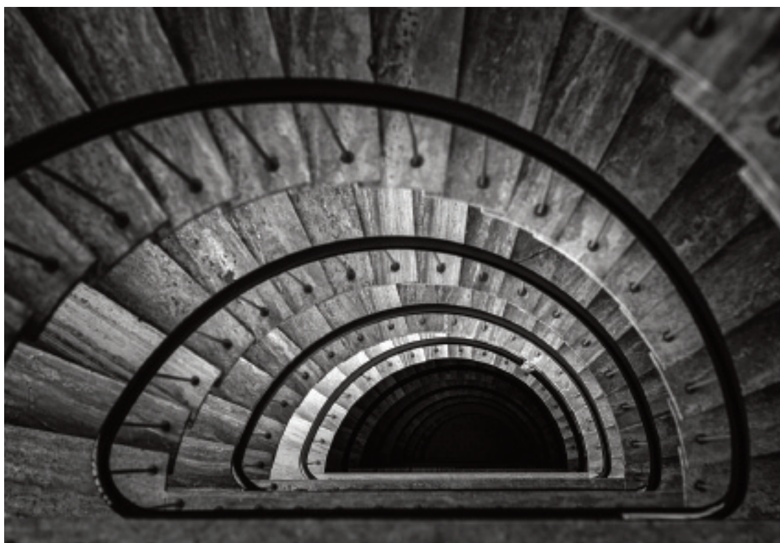
En toute discrétion, Sion

D'autres n'avaient pas forcément envie d'écrire, ou ne se sentaient pas à l'aise avec l'écriture. Comme je tenais à leur participation, leur contribution s'est faite sous la forme d'interviews.