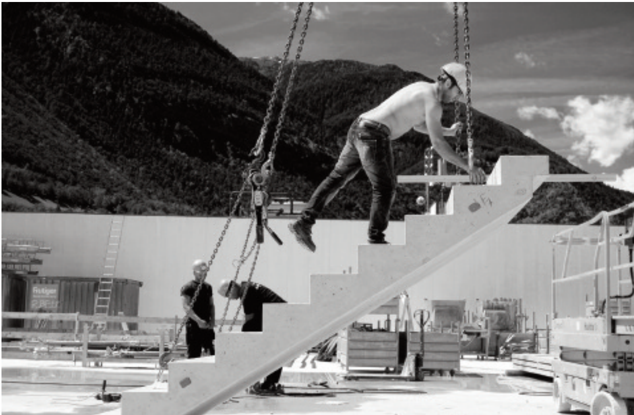
Marche à suivre

Dès le 7 décembre 2016 dans toute la Suisse