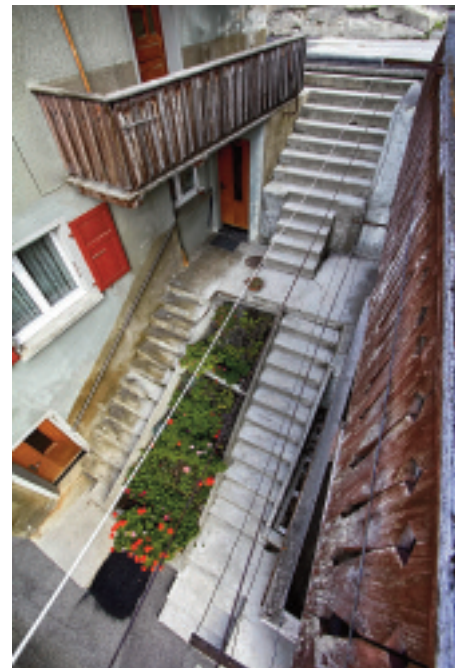
Vue plongeante sur un escalier d'Iséables

(sa propriétaire, la Caisse Hypothécaire, demandait une trop importante compensation)