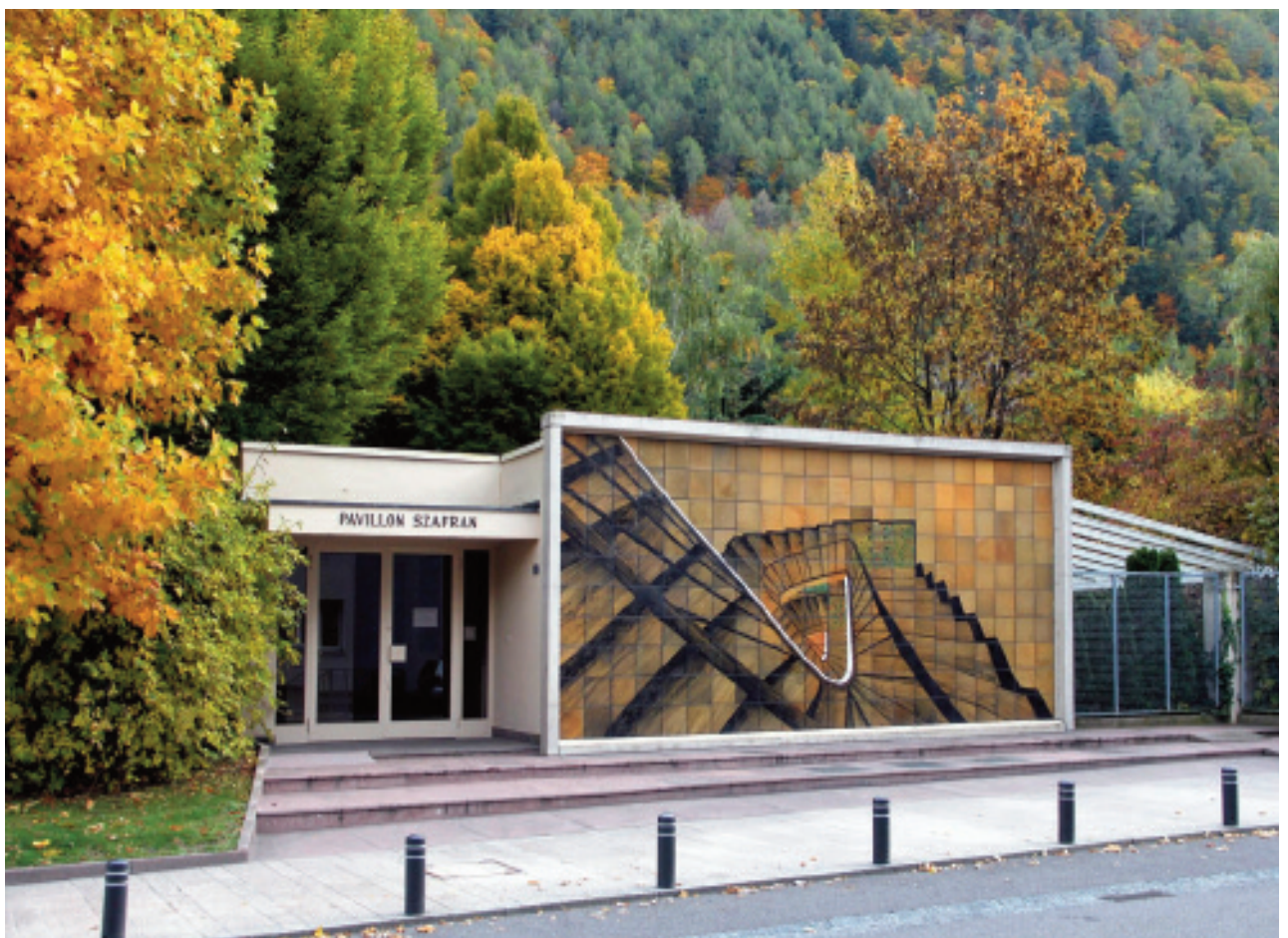
L'escalier de Sam Szafran de la Fondation Gianadda