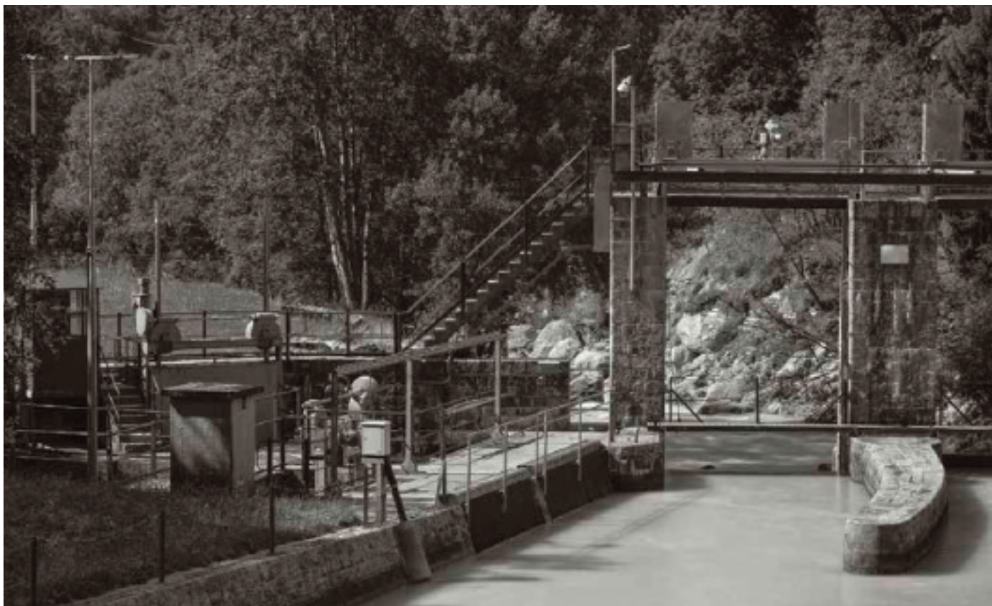
L'énergie brute, Fiesch