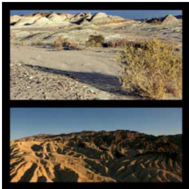
De haut en bas Valle de la Luna Argentina Zabriskie Point, Death Valley California - USA