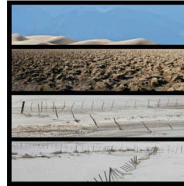
De haut en bas Dunes de sable Death Valley - California - USA Devil's Golf Course Death Valley - California - USA Valle Fertil - Argentina Valle Fertil - Argentina