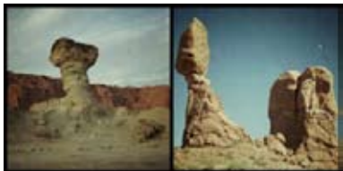
De gauche à droite