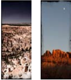
De gauche à droite Bryce Canyon National Park Utah - USA Moab at sunset Utah - USA