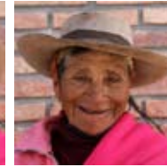
San Antonio de los Cobres Argentina