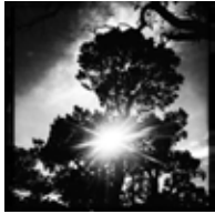
Gran Canyon Arizona - USA