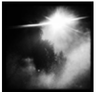
Los Angeles California - USA