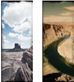
De gauche à droite Monument Valley Arizona - USA Horseshoes Bend, Page Arizona - USA