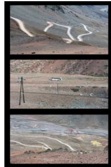
De haut en bas Cristo Redemptore Argentina Las Puentes del Inca Argentina Las Cuervas Argentina