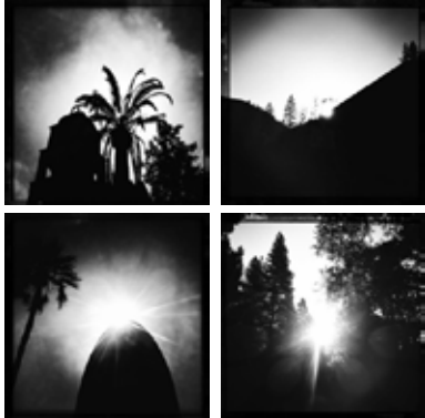
San Diego California - USA