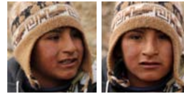
San Antonio de los Cobres Argentina