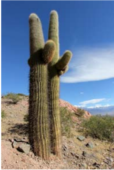
Cactus géant - Trichocereis hedgesii A la porte de San Antonio de los Cobres Argentina