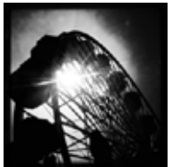
Santa Monica California - USA