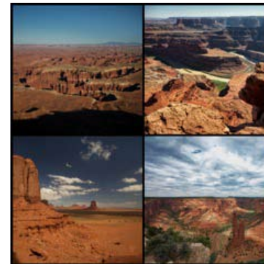
En haut, de gauche à droite