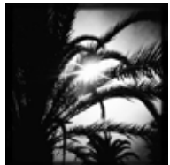
San Diego California - USA