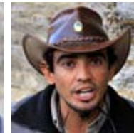
Valle de la Luna Argentina