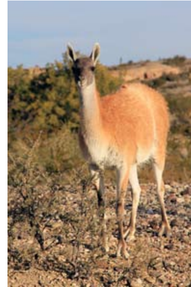
Guanaco de la Valle de la Luna Argentina