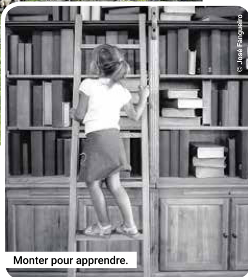
Monter pour apprendre.

Lui consacrer un ouvrage s'impose comme une évidence, par le fait que la Suisse détient le record du plus long escalier du monde et que cet organe de la circulation verticale, souvent banalisé, a besoin de retrouver ses lettres de noblesse. Fondé sur des observations, expériences et questionnements de 39 auteurs, cet