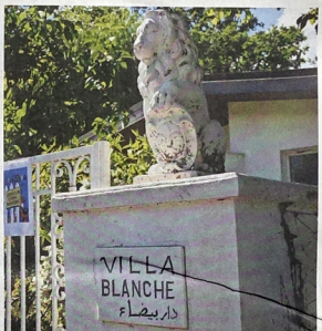
Chaque plaque raconte une histoire, domestique, familiale, ou éclaire un pan du passé communal. Partir sur leurs traces permet une exploration inédite de ce coin du canton. STEVEE JUNKER-GOMEZ